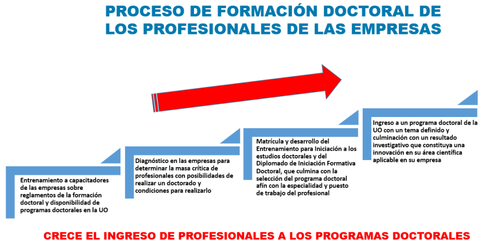
Fig. 2. Sistema de acciones para potenciar el vínculo de la UO con los sectores productivos y de servicios del territorio, con vista a la formación doctoral.

Para potenciar estos resultados se aplicó un sistema de acciones que fortaleció el vínculo de la UO con los sectores productivos y de servicios del territorio. En la figura 2 se muestran las acciones desarrolladas en esta dirección.